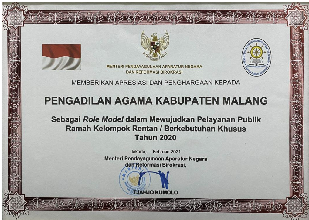
Gambar 1. Piagam Penghargaan Role Model dalam Mewujudkan Pelayanan Publik Ramah Kelompok Rentan/Berkebutuhan Khusus Tahun 2020 dari Kemenpan RB