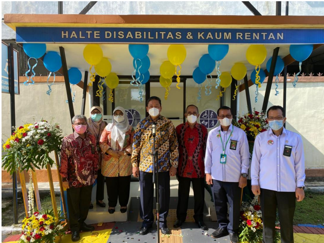
Gambar 2. kika , Sekretaris PTA Surabaya, Panitera PTA Surabaya, Direktur Pembinaan Administrasi Peradilan Agama Ditjen Badilag, Direktur Jenderal Badilag, Ketua PTA Surabaya, Ketua PA Kab Malang dan Wakil Ketua PA Kab. Malang saat peresmian Layanan Disabilitas di PA Kab. Malang.